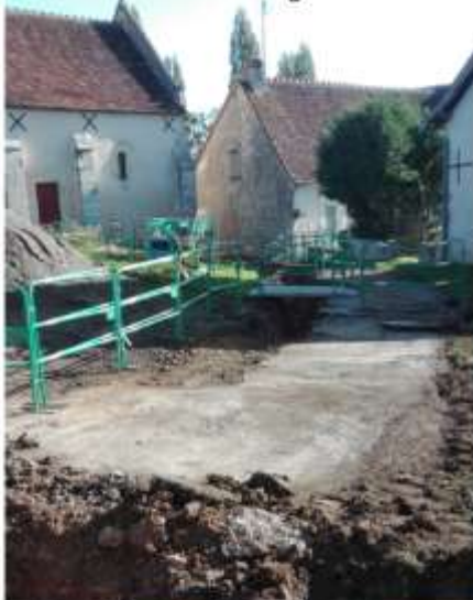
Travaux aux abords de l'église de Nesmes

Nature des travaux : renouvellement de 12 km de réseaux fuyards, réfection de 85 branchements, renouvellement des passages de rivière en forage dirigé (x3)