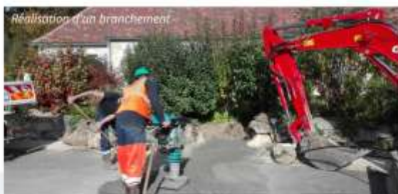
Réalisation d'un branchement