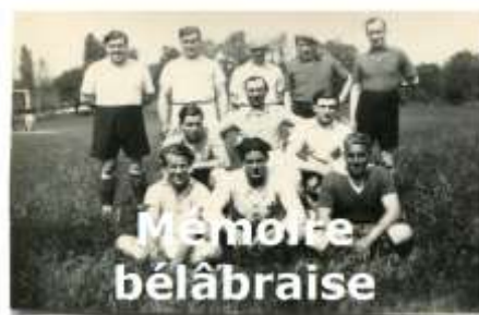
N°4 - 2021