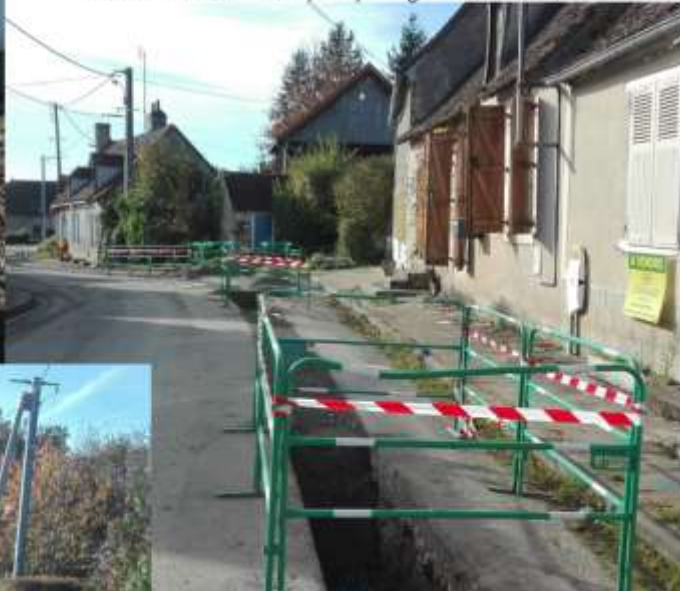
Ouverture des tranchées pour passage des nouvelles canalisations

Agence de l'Eau Loire Bretagne (dans le cadre du plan France Relance) (30%), Département de l'Indre (10%) Syndicat des Eaux (60%)