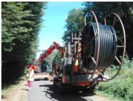
Pose des nouvelles canalisations à la trancheuse

Nature des travaux : renouvellement de 3,5 km de réseaux relarguant du CVM, réfection de 25 branchements,