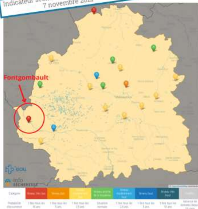
Indicateur Jurassique supérieur (Malm 36)

Indicateur sécheresse : Nappes phréatiques 7 novembre 2021